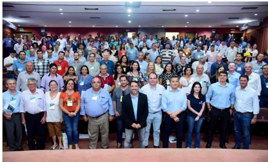
Sindicatos prestigiaram o Encontro Técnico Senar Forte.