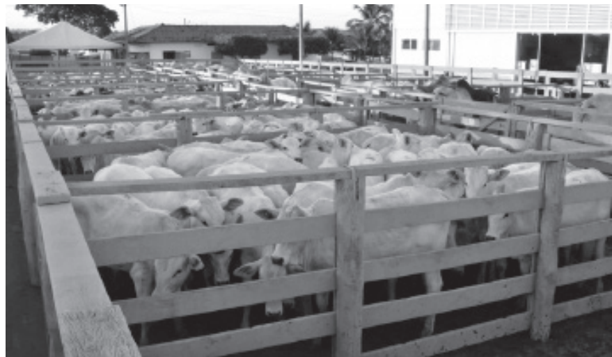
Durante os leilões haverá premiação para os melhores lotes.

03/07 - Quarta-feira - 19h. LEILÃO MISTO GADO DE CORTE.