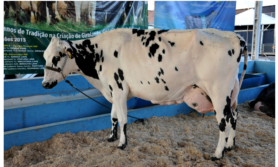
Animais girolando com alta produtividades participaram do evento.