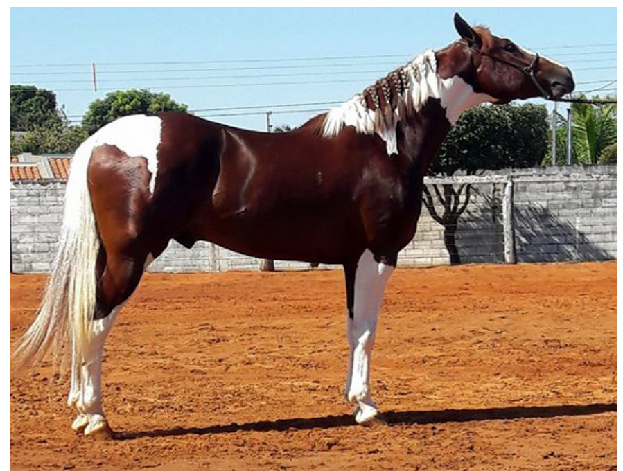
A qualidade e organização no julgamento dos animais é tradição.